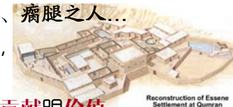
Reconstruction of Essene Settlement at Qumran